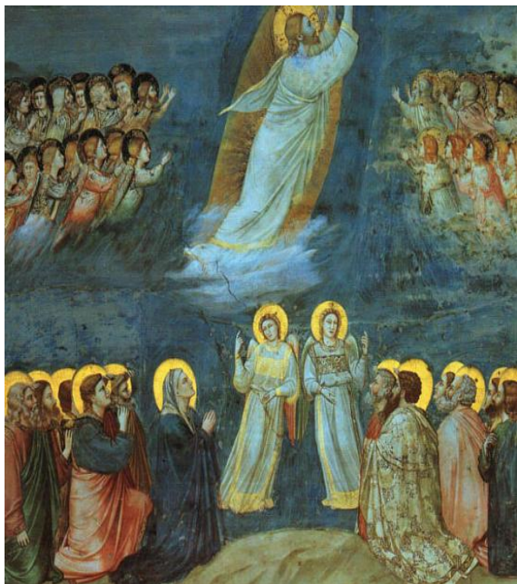
L'Ascension de Giotto

L'Ascension pourrait, à première vue, nous donner l'impression d'un départ : Jésus s'éloigne, disparaît au regard de ses disciples, quitte ce monde. Pourtant, la liturgie nous invite à comprendre exactement l'inverse : L'Ascension n'est pas l'absence du Christ ; mais puisqu'elle est son entrée définitive dans la gloire du Père, elle est l'expression du fait qu'il demeure désormais pour toujours avec notre humanité.